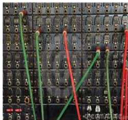
Painel de comando de telefone do vintage

desejássemos. Isto era feito através de uma telefonista que fazia a ligação manual introduzindo um cabo num painel equipado.