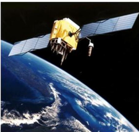
Tecnologia de informação em Angola em passo de desenvolvimento

Em 2012, os russos vão colocar em órbita um satélite para Angola, designado Angosat, conforme ficou acordado aquando da visita a Luanda, em Junho de 2009, do presidente Dmitri Medvedev.