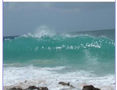
Ondas normais que se forma na costa.

Foi a causa do desastre no Japão. São ondas criadas por terremotos no fundo do oceano. O tempo em que as ondas atingem a costa, elas podem ter vários metros de altura.