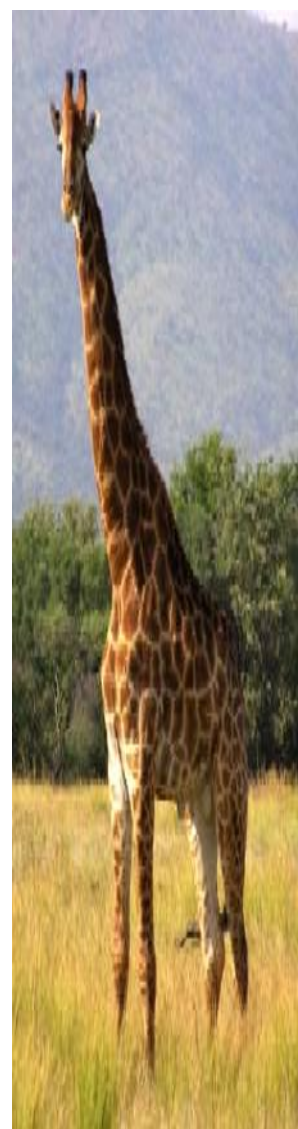
Lindo animal , Quenia

Apesar do tamanho, o pescoço de uma girafa tem apenas sete ossos, o mesmo número de ossos do pescoço de um ser humano. A cabeça da girafa fica a mais de dois metros de distância do coração. Para fazer o sangue subir, o coração precisa ser muito forte. O coração da girafa é 43 vezes maior que o do ser humano.