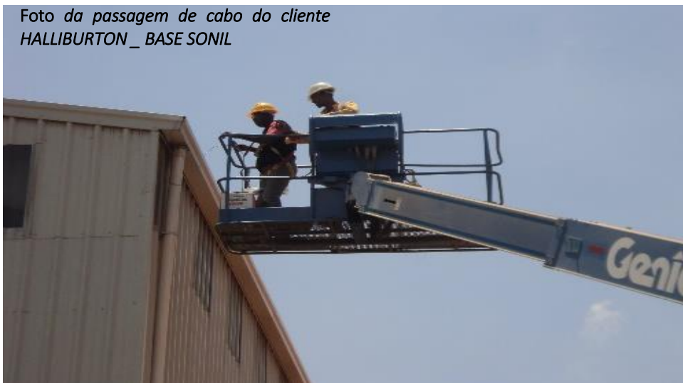
Foto da passagem de cabo do cliente HALLIBURTON_ BASE SONIL